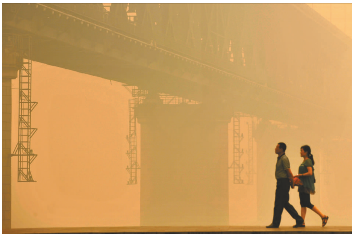
昨日，江城遭遇大雾天气，发黄的雾霾似沙尘暴一般。图为武汉长江大桥笼罩在雾霾中若隐若现。