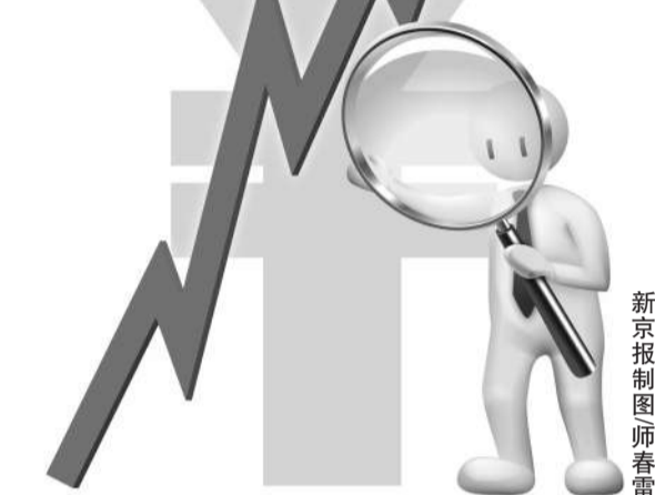
数据:新京报记者 李蕾 整理