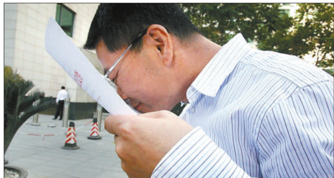
5月24日,湛江市市长在国家发改委门前亲吻批复文件。