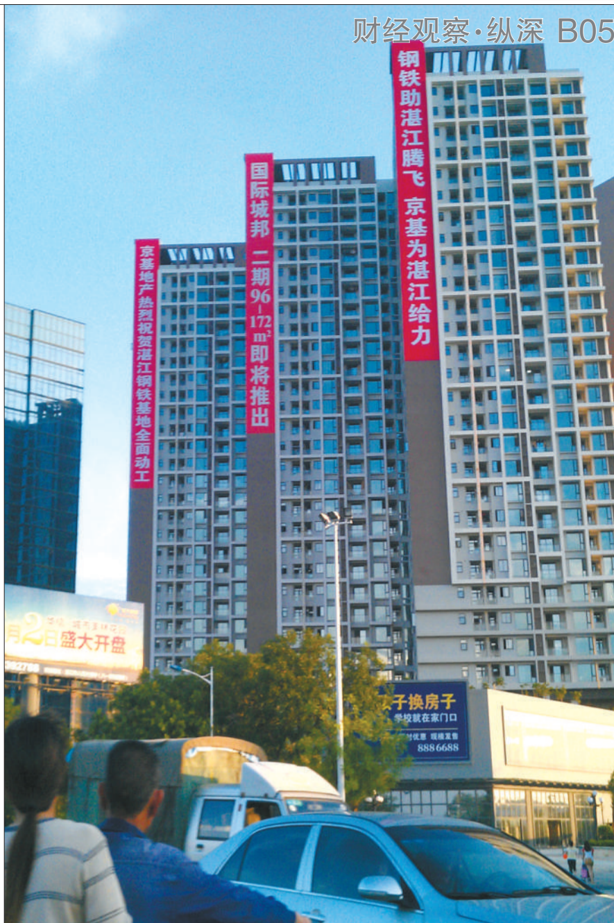
5月31日,湛江市市区一家楼盘挂上“钢铁助湛江腾飞”的条幅。

宝钢集团董事长徐乐江此前对媒体介绍,作为节能环保的保证,宝钢在湛江钢铁项目中投入80亿元资金和116项先进成熟技术,该项目在节能减排的指标设计上向世界一流水平看齐,项目实现吨钢综合能耗575千克标煤,处于国内领先水平。