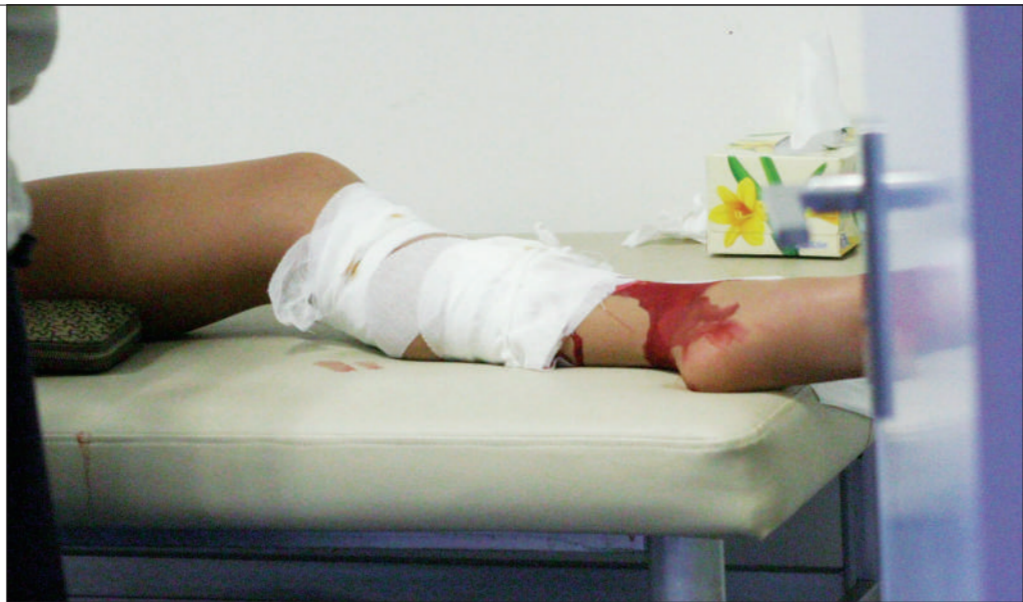
经过积极治疗8周以上还无法愈合的伤口被称为慢性创面,处理不好就很难痊愈。