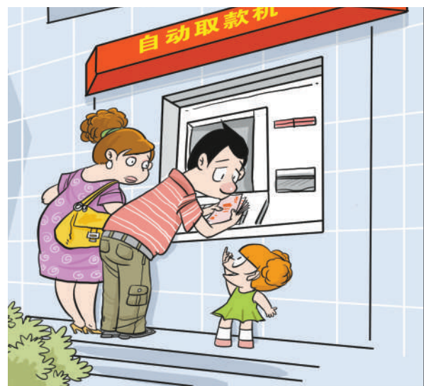
我们买个取款机捐给灾区吧!