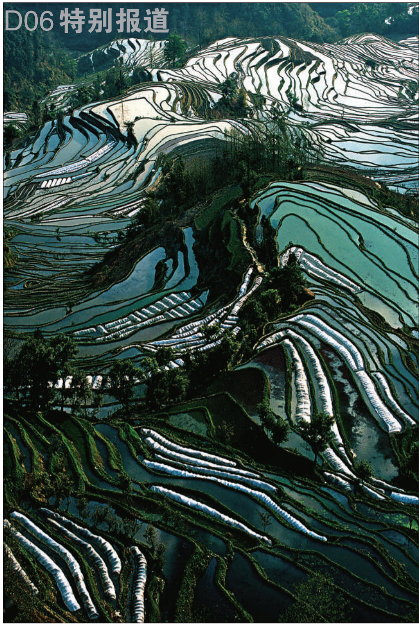
云南红河州元阳县哈尼梯田入选“全球重要农业文化遗产保护项目试点”。