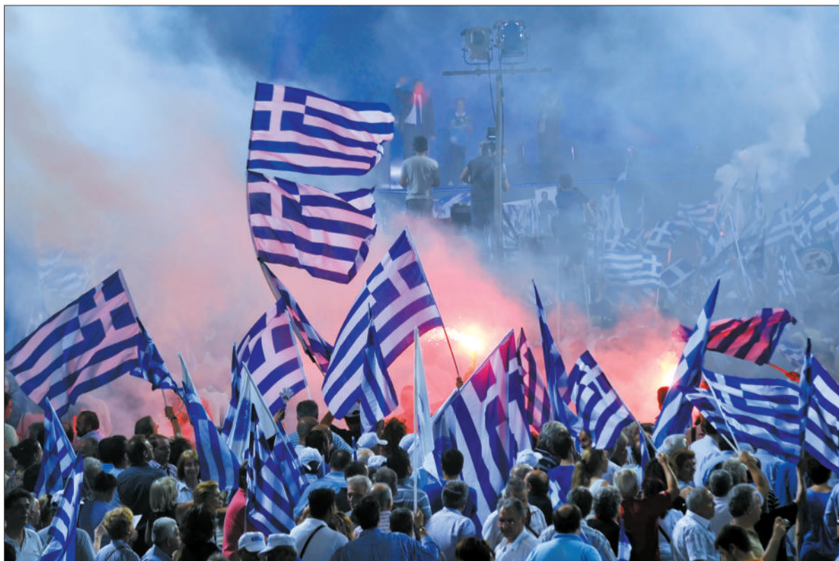
6月15日,希腊宪法广场,新民主党支持者挥舞着希腊国旗。