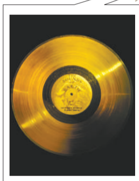
唱片有12英寸厚,镀金表面,内藏留声机针。右图为唱片封面。