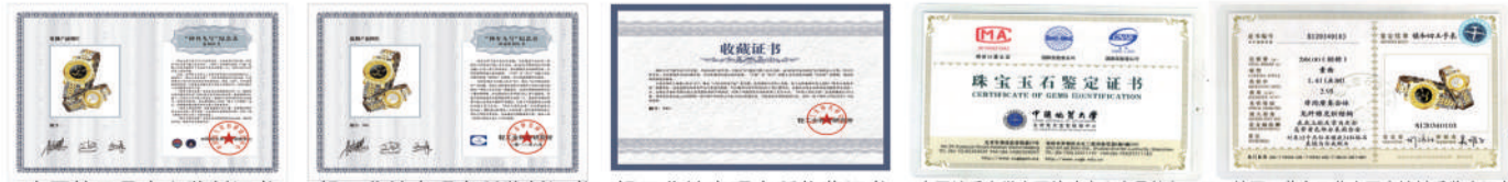
中国航天员中心监制证书 轻工业钟表研究所监制证书 轻工业钟表研究所收藏证书 中国地质大学宝石检验中心出具的和田玉、钻石、黄金及蓝宝石表镜材质鉴定证书

“中国第一位航天女英雄的飞天让我们万分骄傲,世界第一款献给女性的航天纪念表戴出自自豪!”市民郑女士兴奋地表示:“太空也有女性的半边天!这是世界上从来没有过的航天女表,展现智慧优雅、干练自信的巾帼气概,收藏佩戴,就是高贵大气,与众不同!”