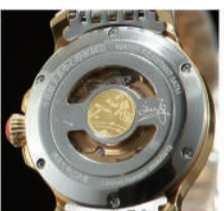
中国第一位女航天员签名