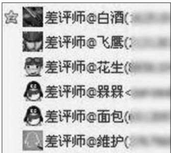
差评师的QQ群。网络截图