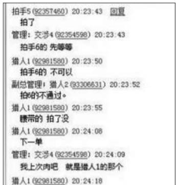
差评师在QQ群中分工。