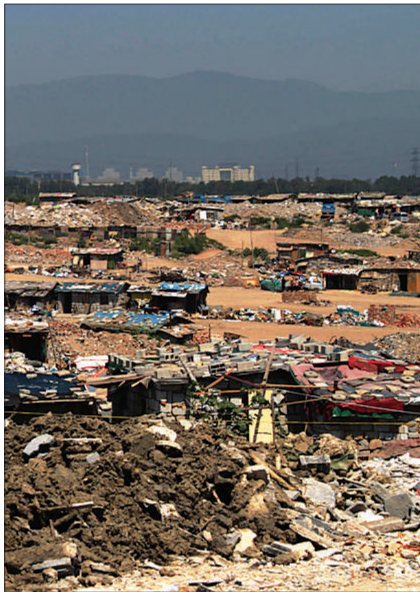
位于长辛店镇河西区的园博会会场施工前是一片垃圾场。