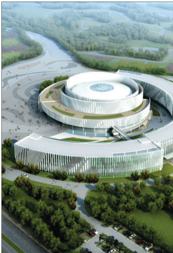
园博园施工后的效果图。