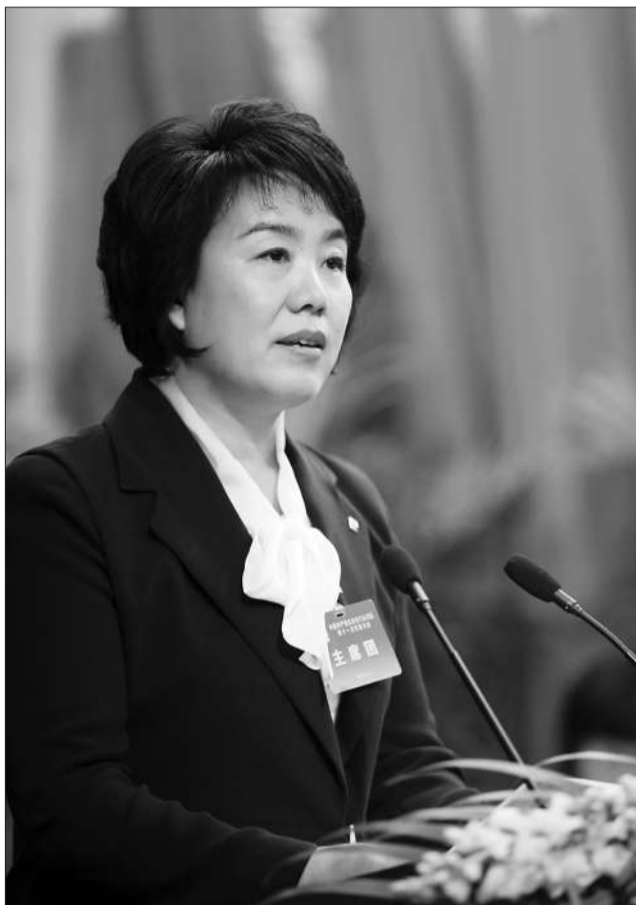
去年底,门头沟区委书记韩子荣在区党代会上发言。

走进门头沟,人们会惊奇于这里正悄然发生的变化:曾经干涸的永定河又有了水的滋润,沿途是整洁漂亮的水系、公园,山上黑乎乎的小煤窑不见了,原来住在采空棚户区的居民住进了新楼房……6月11日,门头沟区委书记韩子荣在接受记者采访时,详解在最近5年里,门头沟从京西矿区变为滨水山城这一跨越式转型发展的历程。