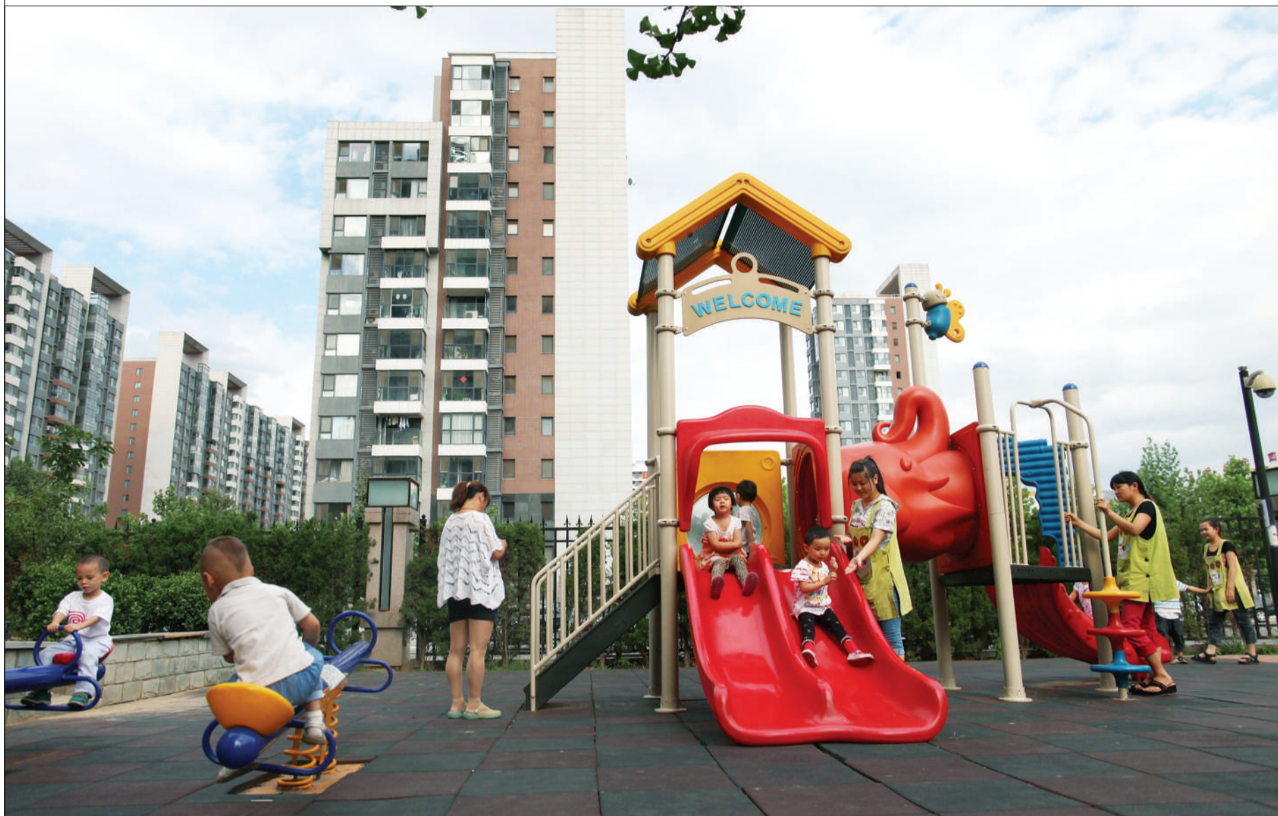
6月14日,在朝阳区一个小区内,某小规模幼儿园的孩子们借助小区中配套的幼儿活动设施进行户外活动。