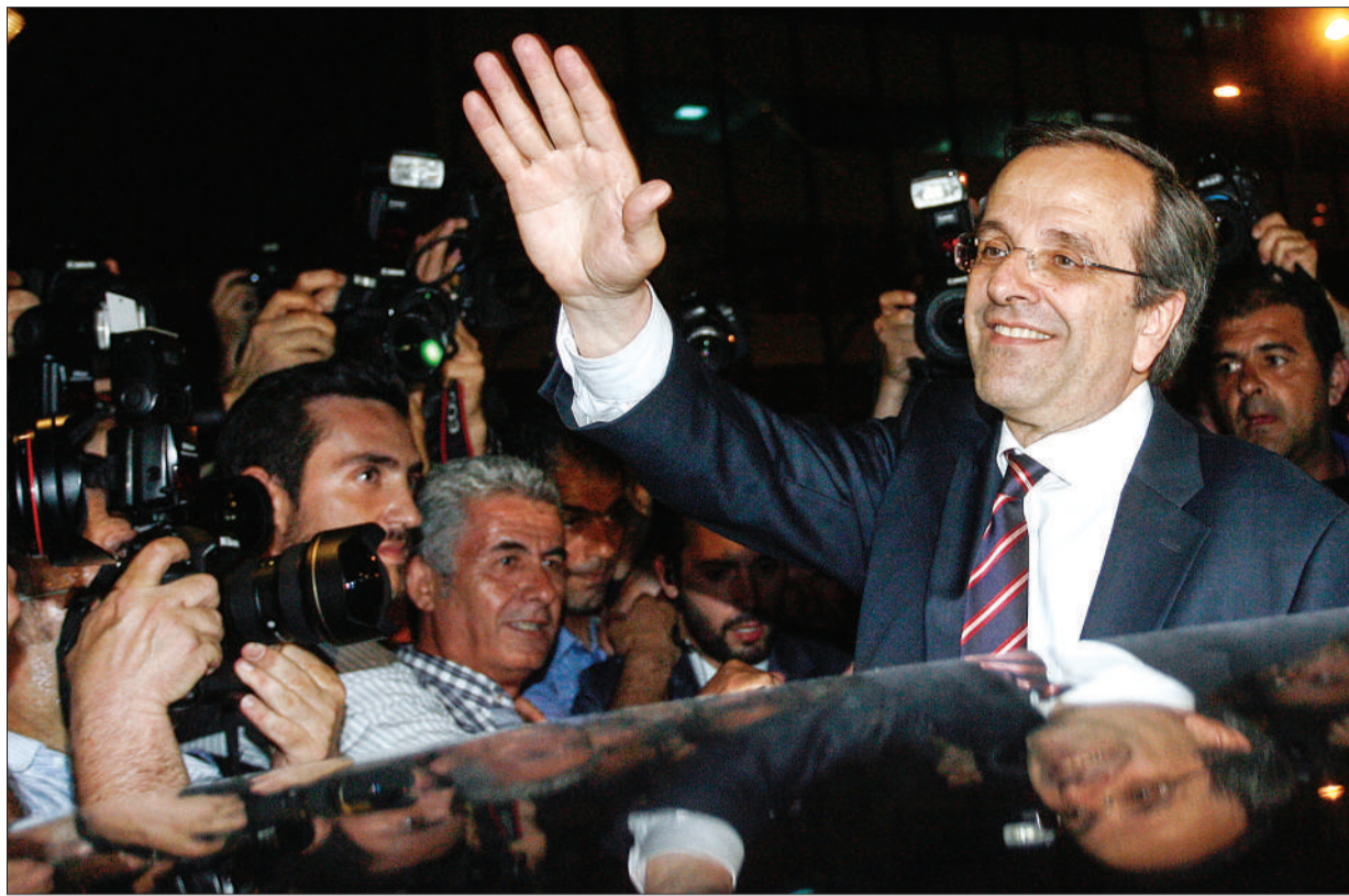
17日夜,希腊雅典,新民主党领导人萨马拉斯得知初步选举结果后,向支持者表示感谢。

次第二轮议会选举在国际上引起了很大的重视。当前希腊确实面临着严重的主权债务危机的挑战,这次选举之后还有很多的工作要做,特别是在今后的几天希腊将在选举的基础上组成新的政府,我们希望这个政府有着广泛的基础,保持一个稳定的态势。”