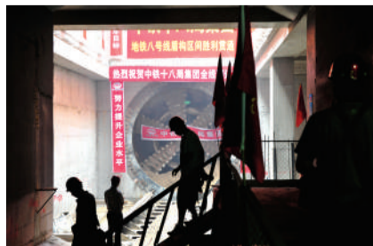
昨日下午,地铁鼓楼大街站8号线工地内,工人们在为3站贯通仪式做准备。

在装修风格上,鼓楼大街站主打色为红色,并根据其地域特点,在装修及灯具、工艺品设置上有所体现。