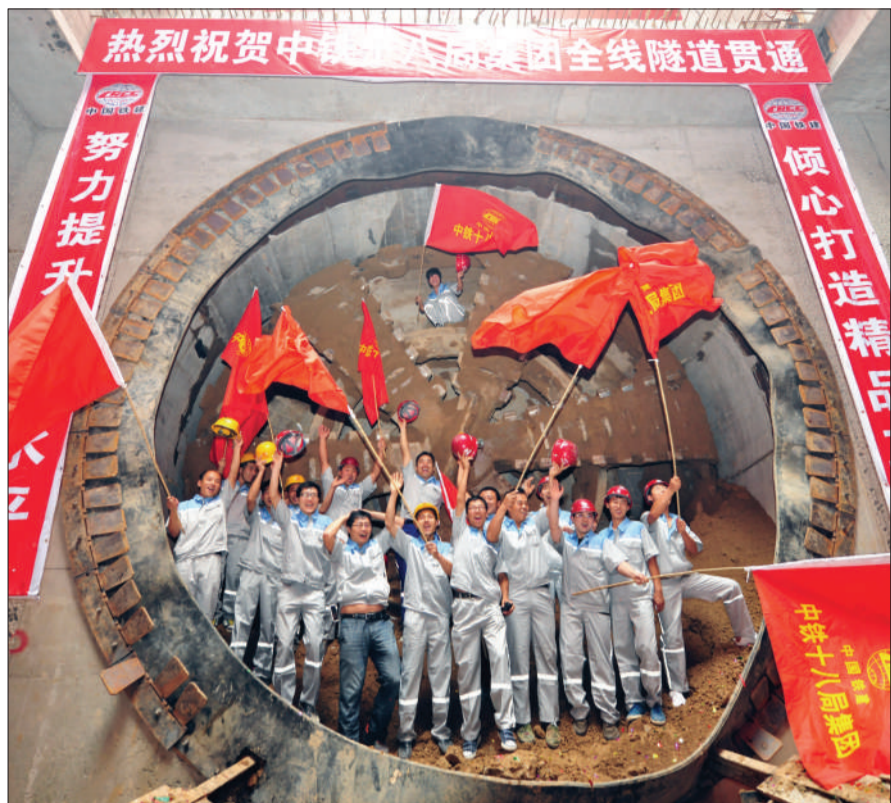
昨日下午,地铁鼓楼大街站8号线工地内,盾构机前,工人们挥旗呐喊扔帽子,庆祝8号线二期南段3站洞通。