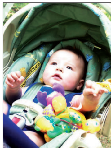
车载睡篮可以让宝宝安稳地在车里睡觉。