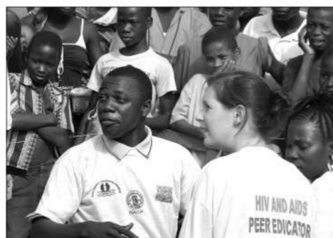
在非洲宣传防治艾滋病知识的外国大学毕业生。