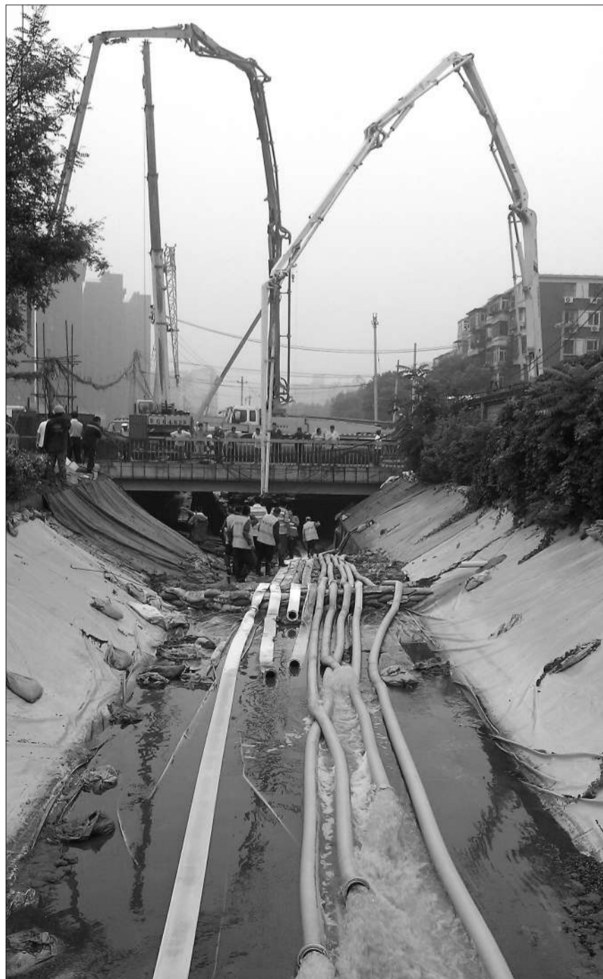
昨日下午,工作人员用水泵将水抽出。当日凌晨,10号线二期角门东站施工工地,附近一河堤垮塌导致河水流入在建隧道。