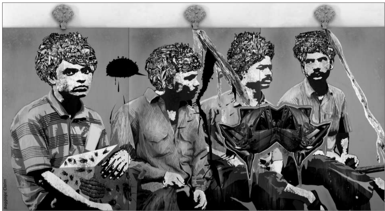
吉蒂什·卡拉特2010年作品《行李提取》,持续其一贯的主题,表现人类苦苦挣扎求生存的悲哀。

反对学生像老师,这是他不断创新这一思维的具体体现。所以他希望他的学生都是“叛徒”,我想是有道理的,因为任何一个人的成功、行为都是不可复制的,所以他希望每个学生都有自己的路。我们现在都在(有自己路)这个过程中。口述:王怀庆,吴冠中学生之一