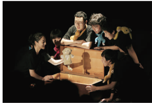
2008年9月,北京青年戏剧节举行,四个剧场推出12名年轻导演执导的戏剧。

2008年9月10日至28日,北京青年戏剧节举办,戏剧节召集了当代中国十二位最为顶尖的青年导演,给在北京活跃多年的戏剧创作者以及来自各个地区的戏剧团体提供一个展现自己的舞台。青年戏剧节雏形出现于2007年“大学生戏剧节”中“青年单元”,每年9月中下旬举办。为青年戏剧人的创作才华提