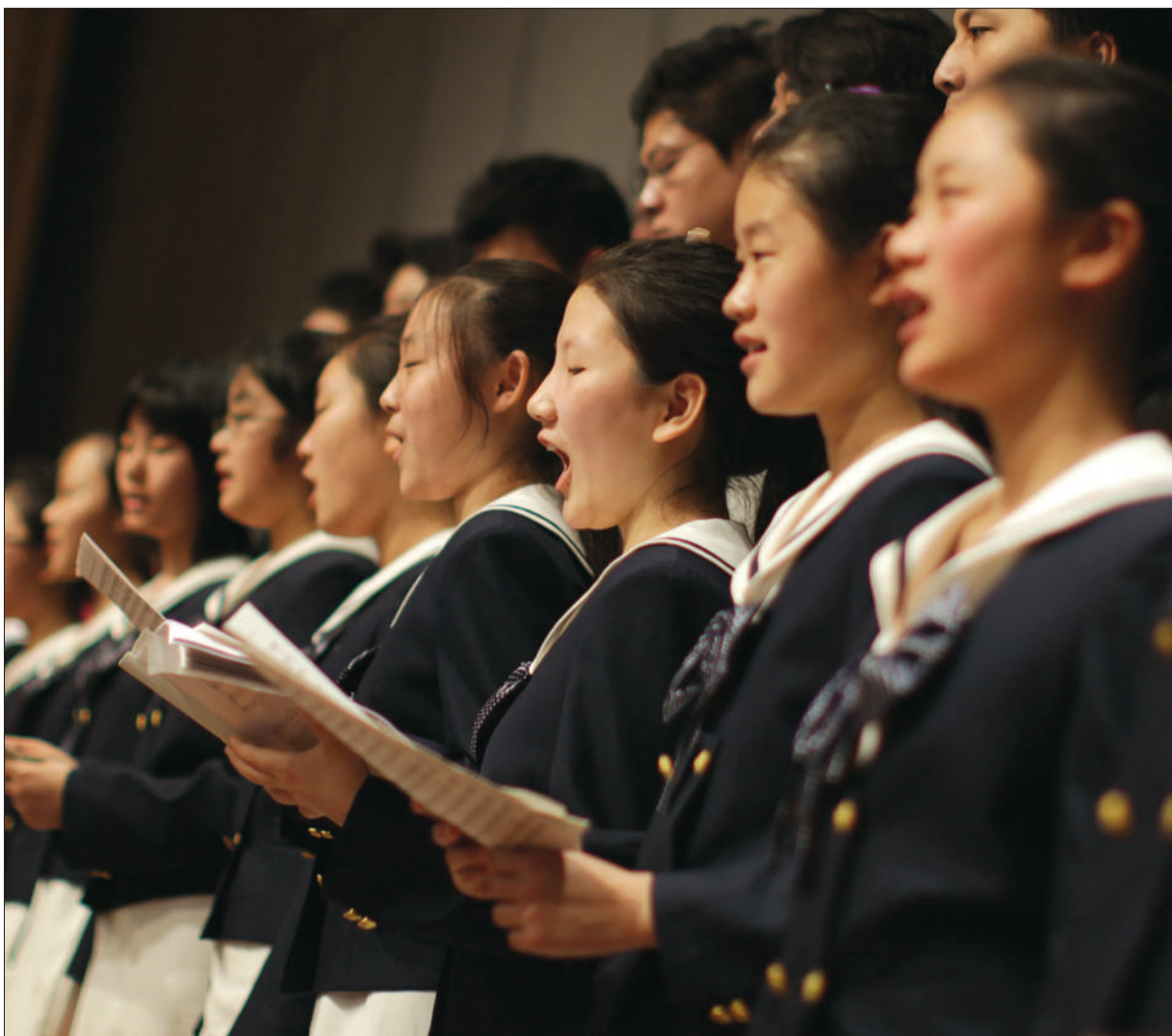
2010年4月11日,国家大剧院小剧场,171中学合唱团的23名学生在排练童声合唱《水滴滴》。