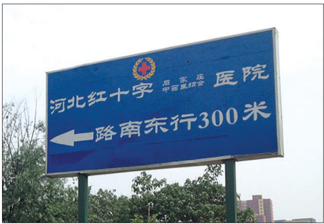
河北红十字石家庄中西医结合医院巨大的指示牌。