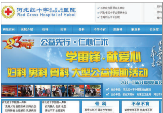
河北红十字石家庄中西医结合医院另一个网址的网页在宣传公益。