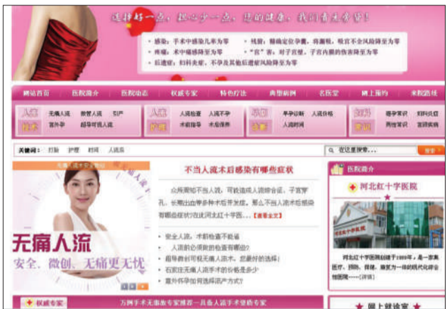
河北红十字石家庄中西医结合医院官网上宣传人流。