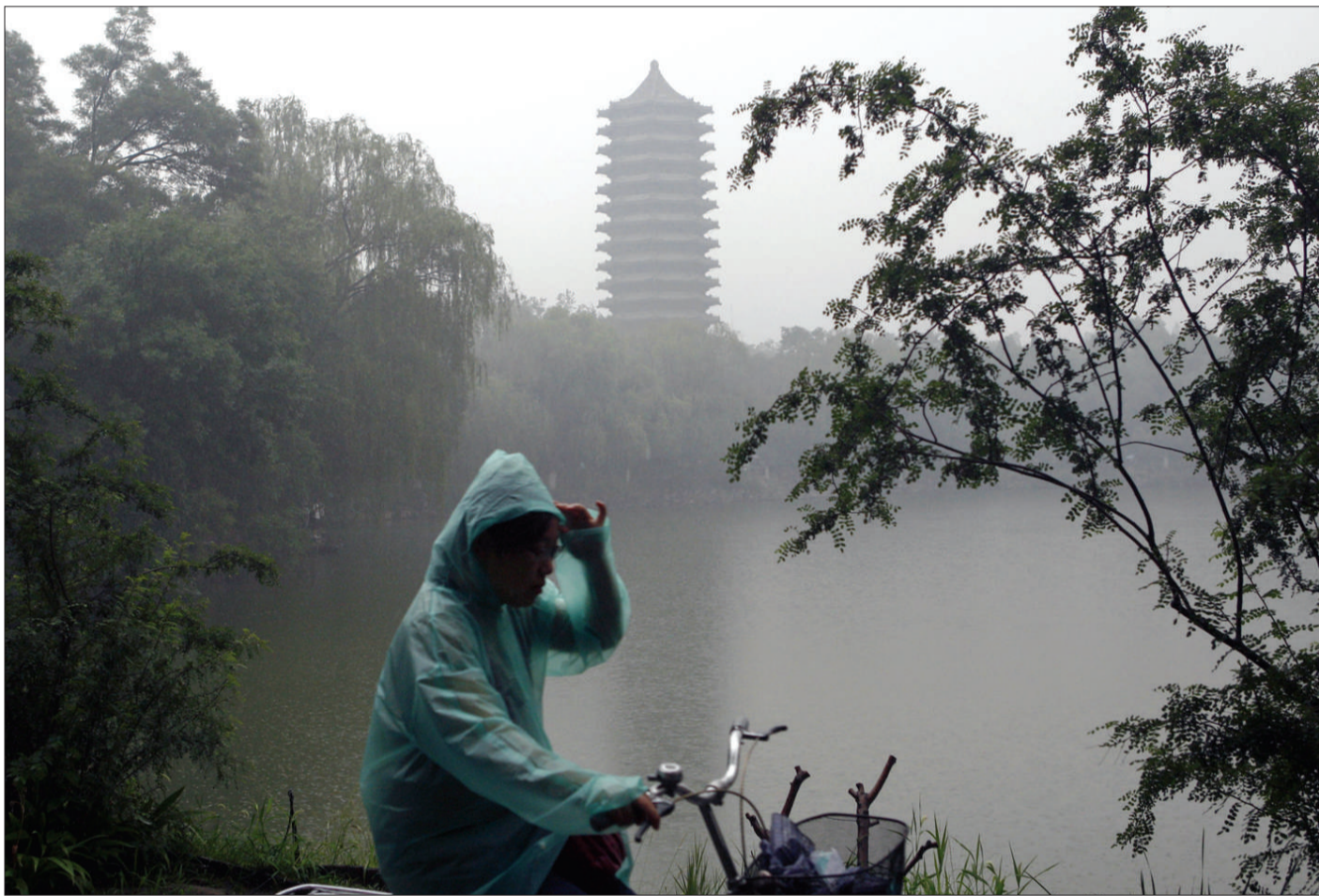
6月24日,一名学生披着雨衣骑过北大未名湖畔。24日至25日6时,北京迎来今年以来的最大一次降水。