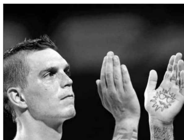
阿格自称全身只有一个文身。