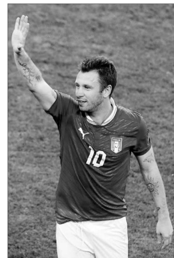
卡萨诺文身向来不爱动脑筋。