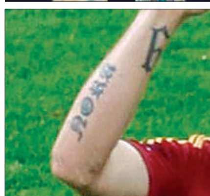
找一找 这几个文身图案分别来自哪个球星。