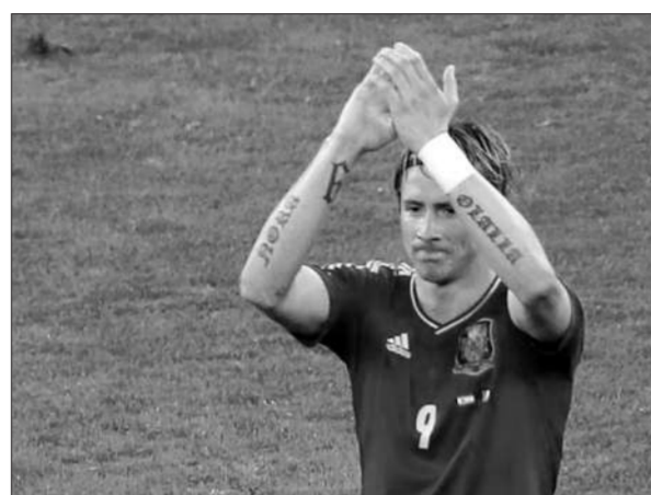
托雷斯文身是表达夺取欧洲杯的决心。