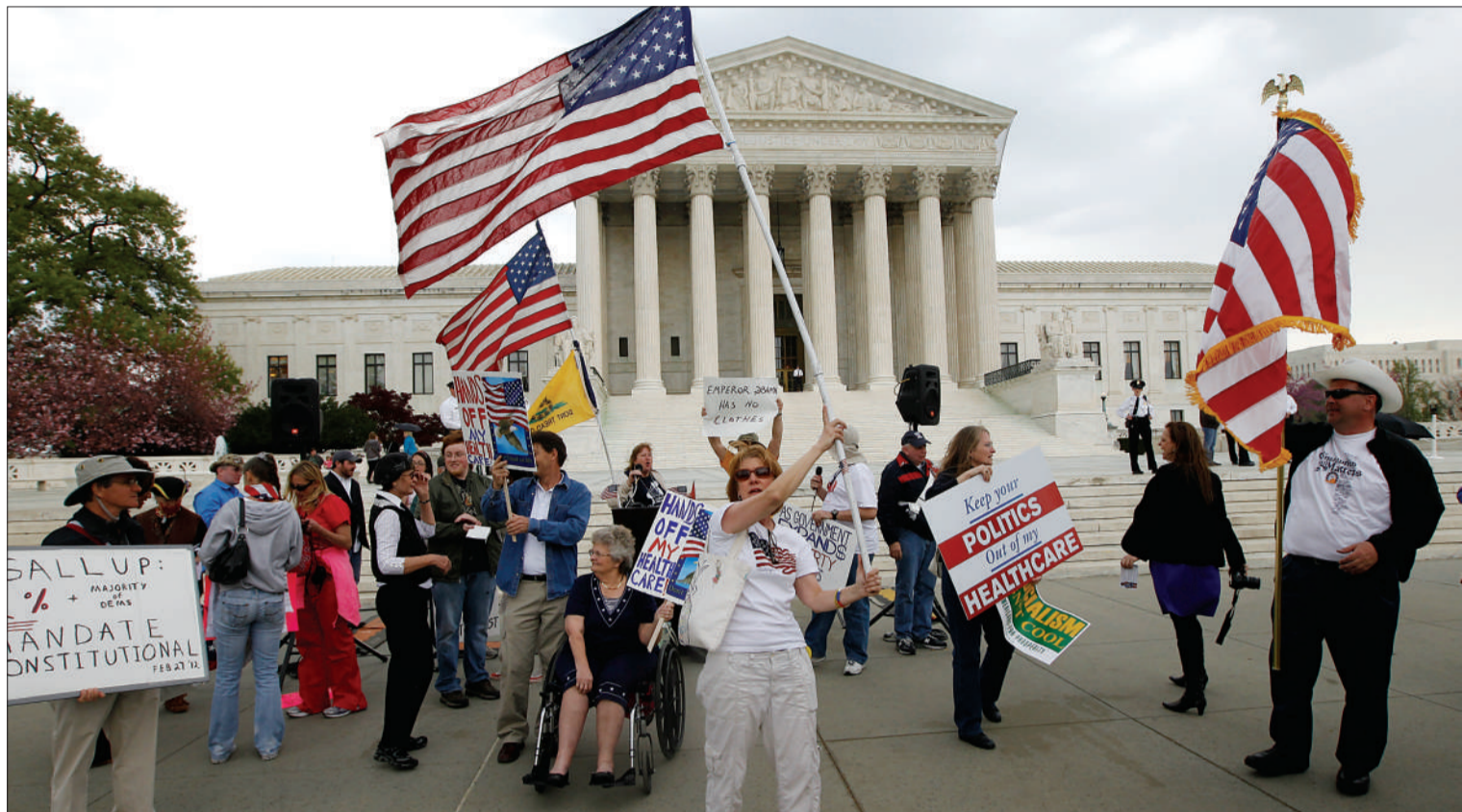
今年3月28日，反对奥巴马医疗改革的民众在联邦最高法院前举行抗议活动。

当地时间28日，美国最高法院，一场影响全美国的官司将在这里终审。案件涉及的是为美国人带来保障的医疗保险改革法案。原告是美国26个州，被告则是奥巴马政府。原告指控称，奥巴马极力推动医改法案包含“强制医保”的条款，违背了美国借以立国的自由原则，因此以违宪为名，将联邦政府告上最高法院。目前，全美国都在等待这一重磅的判决。