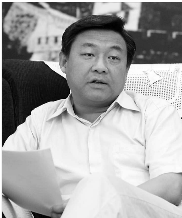
昌平区委书记侯君舒。

在未来科技城等重点功能区建设上强调“职住平衡”，力争将工作区、生活区、休闲区融合