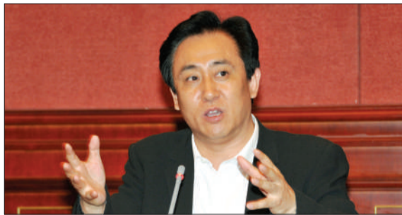
恒大董事长许家印。

尽管美国香橼机构在近日以邮件形式首度回应了中国媒体表示:“决定不会和恒大逐条争辩”,但据相关人士透露,恒大管理层已针对香橼的恶意攻击启动法律程序,并将于近日正式向内地及香港两地相关监管机构报案,要求彻查幕后并起诉肇事者。