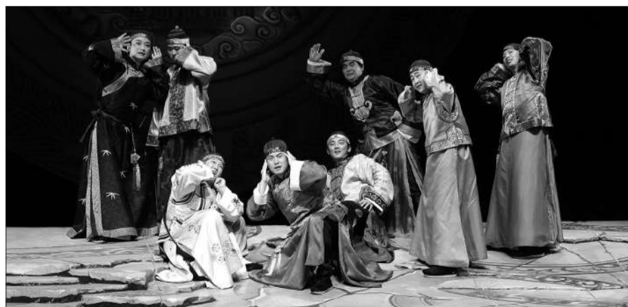
《正红旗下》不但是老舍先生的家族史,也是清末旗人的风俗风情史。

第四届全国少数民族文艺会演由国家民委、文化部、国家广电总局、北京市人民政府共同主办,北京市委、北京市文化局、北京市广电局承办,由北京演艺集团、北京广播电视台、北京市民族文化交流中心执行承办。各有关部门、有关单位高效运转、通力合作,保障了开幕式、闭幕式等大型活动的圆满成功,保障了包括剧场演出和慰问演出在内的94场演出顺利进行,保障了来自全国31个省、自治区、直辖市和新疆生产建设兵团、解放军以及港、澳、台的36个代表团6000多名演职员、工作人员在京的演出和生活。周到细致的服务使各地代表团有了到家的感觉。