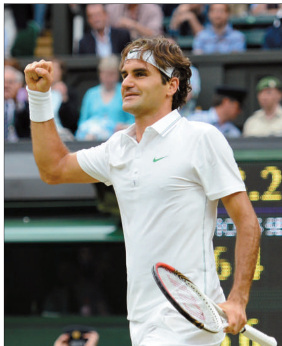
费德勒握拳庆祝闯进男单决赛。