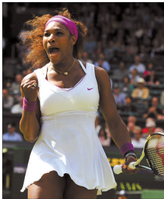
小威庆祝动作和“楼上”保持一致。