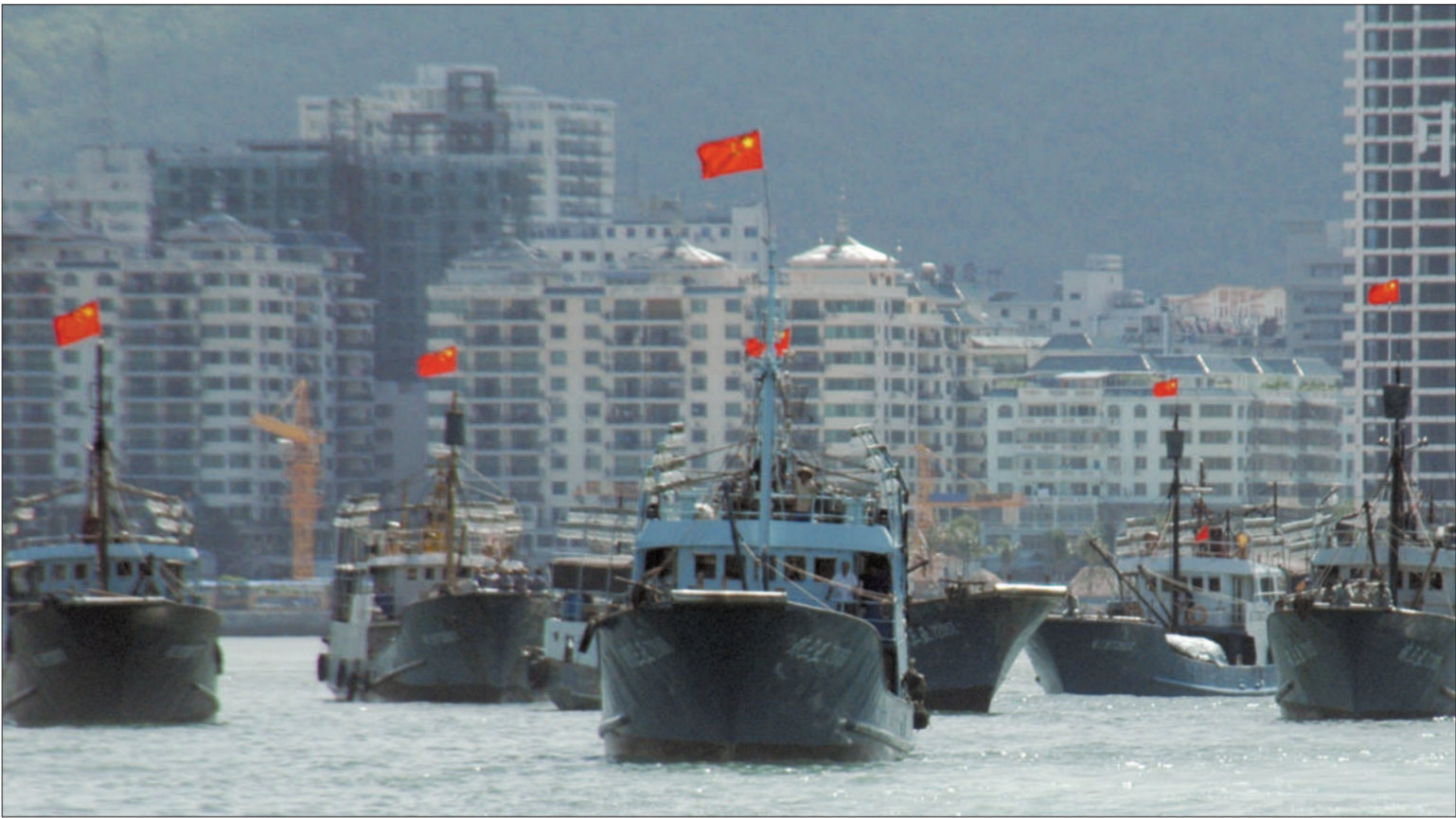
12日上午9时许,海南省30艘渔船自发组成2个编队6个小组的捕捞船队,从三亚出发前往南沙开展捕捞生产活动。

“ 此次发生黄岩岛事件,令中国人感到震惊和意外。菲律宾方面动用军舰在中国领土上伤害中国渔民,在中国引发广泛的关注和民众的强烈不满。中方希望菲方正视事实,不要再制造事端。” ——外交部长杨洁篪