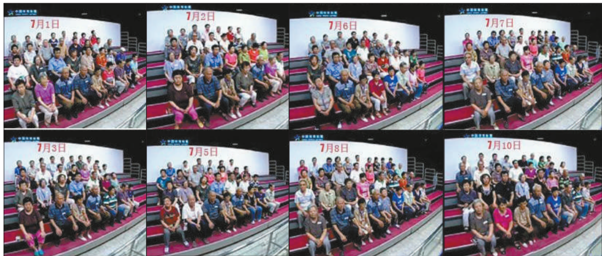
网友质疑,8期开奖视频大部分观众都为同一批人,有人甚至多期没有换服装,只是换了座位。

该工作人员表示,体彩开奖现场对观众有人数限制,最多不能超过40人。刚开始时每天才十几个人报名,现在每天约三四十人。昨日,报名参与的观众为31人。