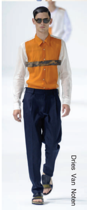
Dries Van Noten