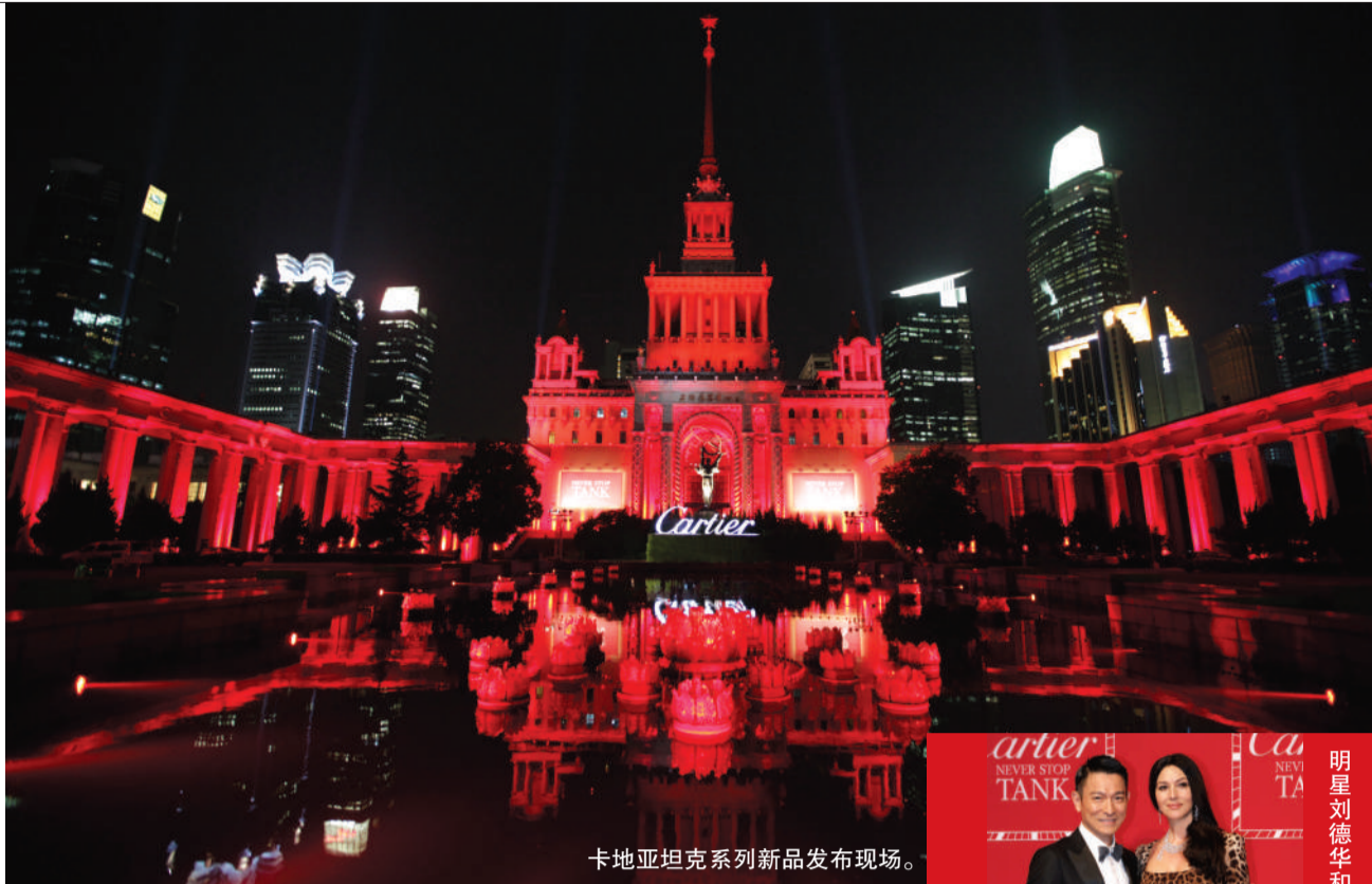
卡地亚坦克系列新品发布现场。

7月6日,卡地亚在上海举行“Never Stop Tank”Tank 腕表之夜盛大派对,呈现了全新的 Tank Anglaise 腕表,并用全景式橱窗,展示了 Tank 腕表家族从诞生至今近百年的历史。