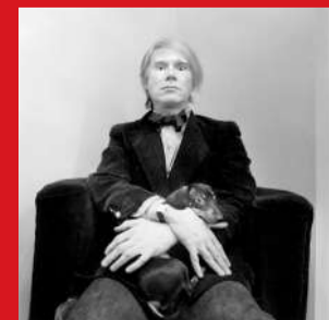
(由上至下)《酋长的儿子》中鲁道夫·瓦伦蒂诺、著名影星克拉克·盖博、时装大师伊夫·圣罗兰、艺术家安迪·沃霍尔佩戴 Tank 腕表。