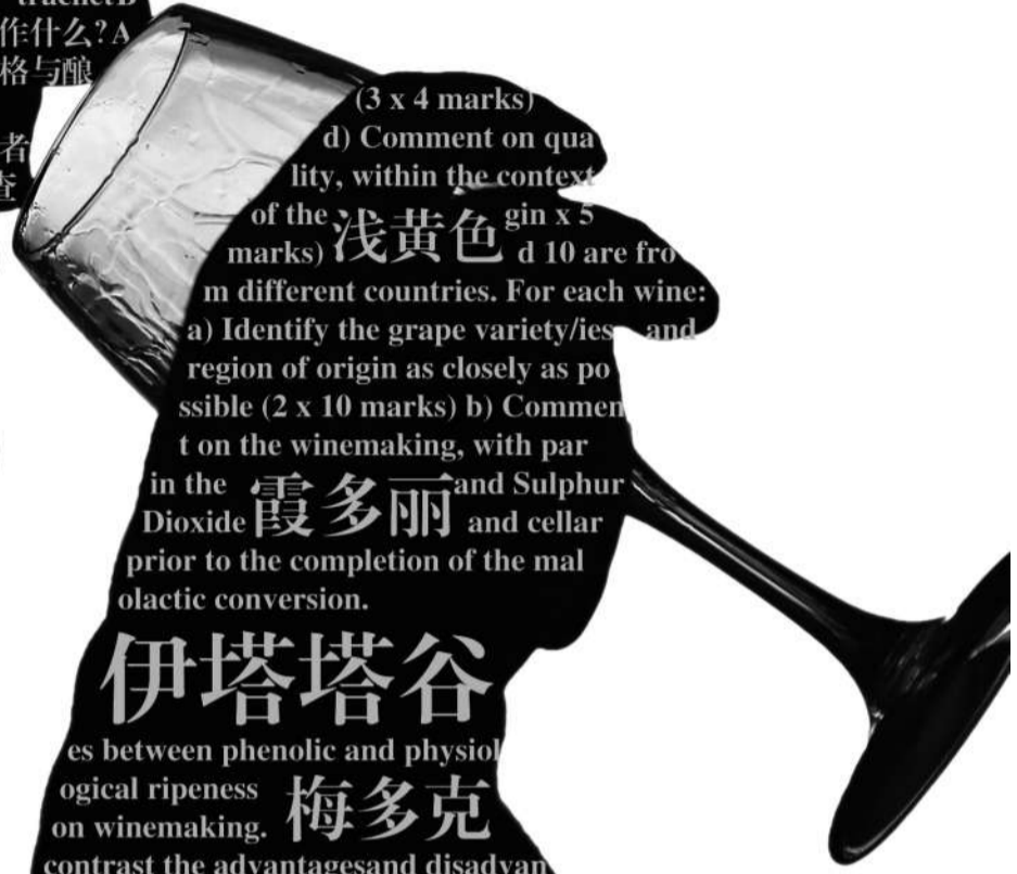
(左图部分题目为逸香葡萄酒教育中级试题DEMO) 新京报制图/师春雷

“参加葡萄酒专业资格考试, 需要通过严格的理论考试和盲品葡萄酒测试, 内容包括葡萄栽培、酿制、市场运作、酒精含量以及所用的橡木等等, 有的甚至要完成一篇博士水平的论文。”