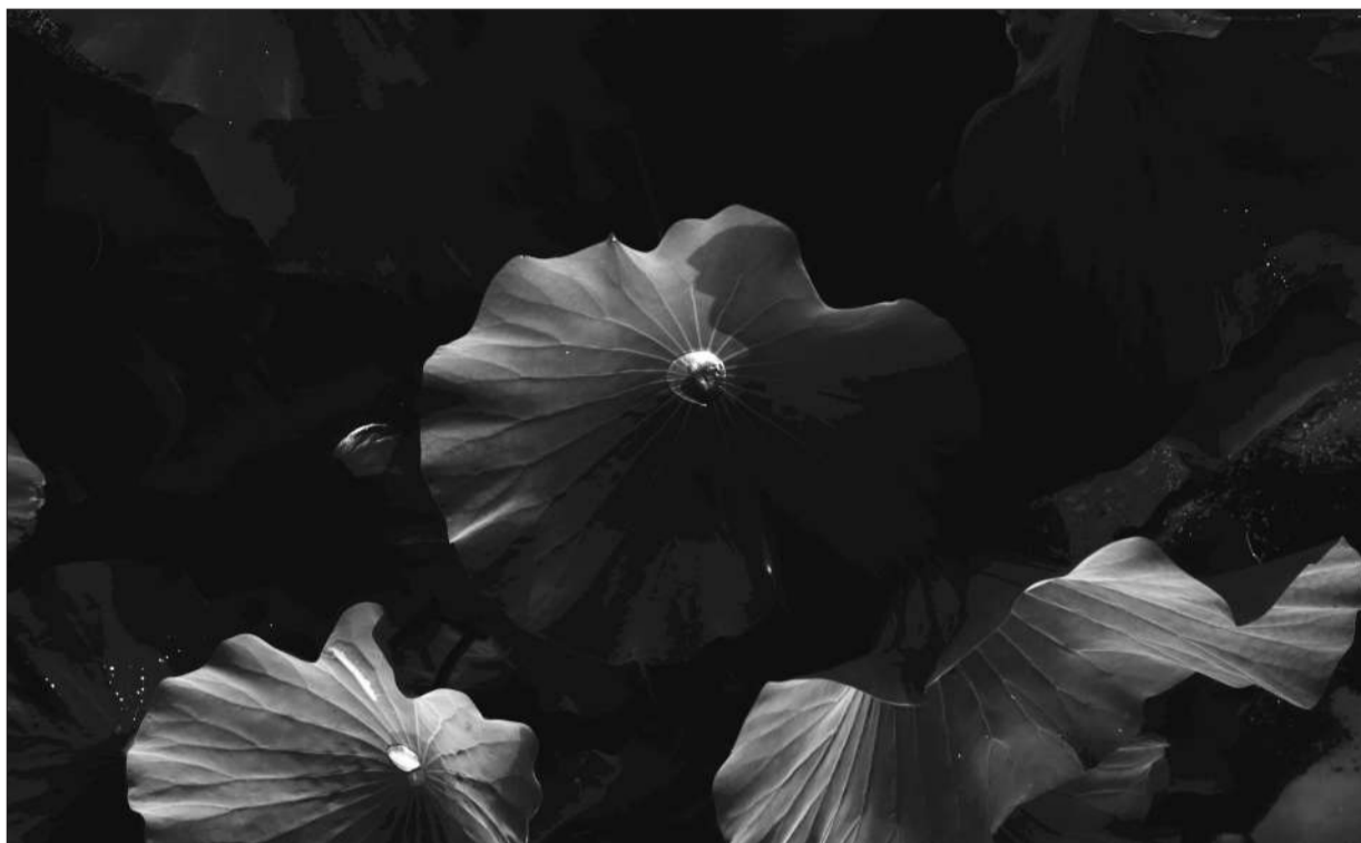
城市表情 眼眸 时间:7月16日 地点:农展馆 场景:荷叶上的点点水珠,仿若明亮的眼睛。