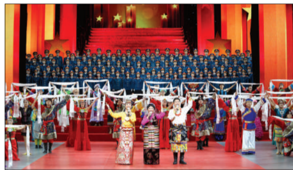
7月12日才旦卓玛演唱《唱支山歌给党听》。

尤其在首场演出中,集合了众多难得出席现场演出的老艺术家们:由于年事已高,不能亲自独唱,77岁的王玉珍身穿当年出演歌剧电影《洪湖赤卫队》的韩英戏服出场;83岁的郭兰英为观众讲述其代表作《我的祖国》。