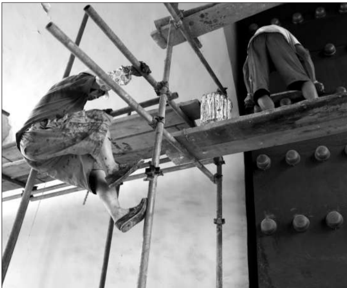
7月13日，工作人员正在对内坛墙的东天门进行修缮。本月底，天坛公园的内坛墙将结束跨越了十年的修缮。

在此次修缮中，内坛墙上的椽子、望板等木制构件也进行了大规模更换。依据内坛墙上保留下来的清朝木料材质，此次修缮中依旧遵循了椽子用杉木、望板用红松的传统用料原则，按照原来的样式将这些木料制作成构件，再涂上防虫防腐药剂，“一百年以上的寿命应该没问题。”曲禄政说。