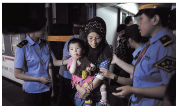
7月17日,北京西站,患儿们到达北京。