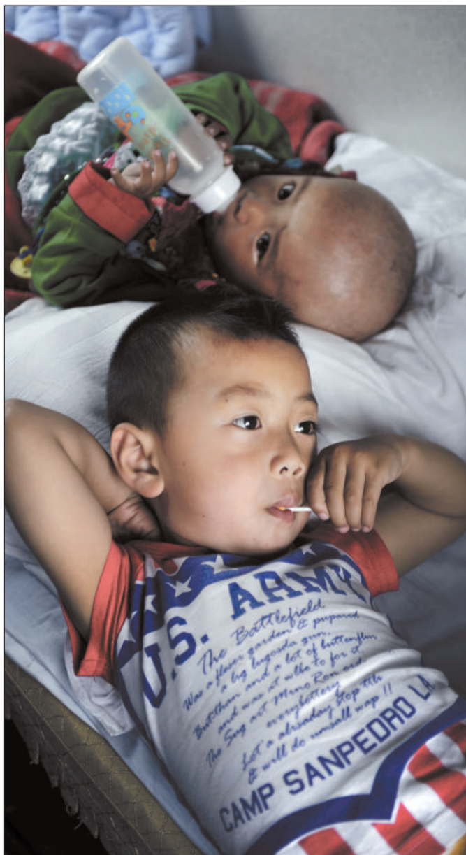
列车上,两名患儿一个在喂奶一个在吃棒棒糖。