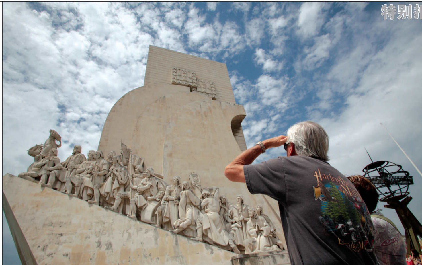
葡萄牙大航海纪念碑。