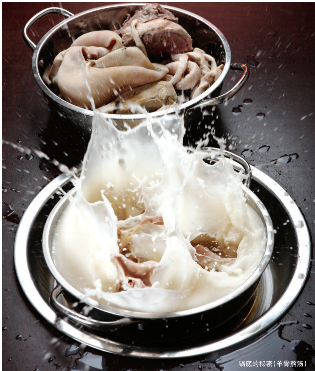
锅底的秘密(羊骨熬汤)