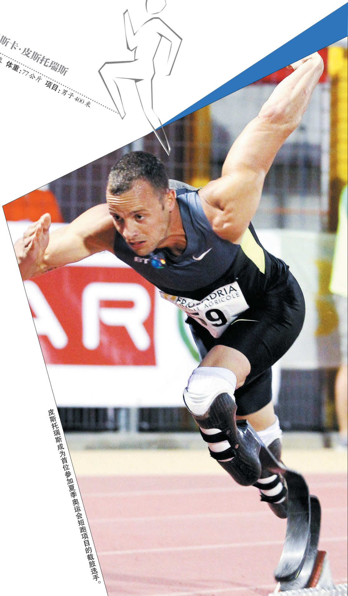
皮斯托瑞斯成为首位参加夏季奥运会短跑项目的截肢选手。

今年7月,皮斯托瑞斯创造了个人历史最好成绩45秒07,达到男子400米的国际A标。虽然他在选拔赛中未达标,但7月4日,皮斯托瑞斯还是出现在南非田协递交的奥运名单中,他将参加400米和4×400米接力两项比赛。这将是奥运史上第一个参加健全人奥运会短跑比赛的截肢选手。