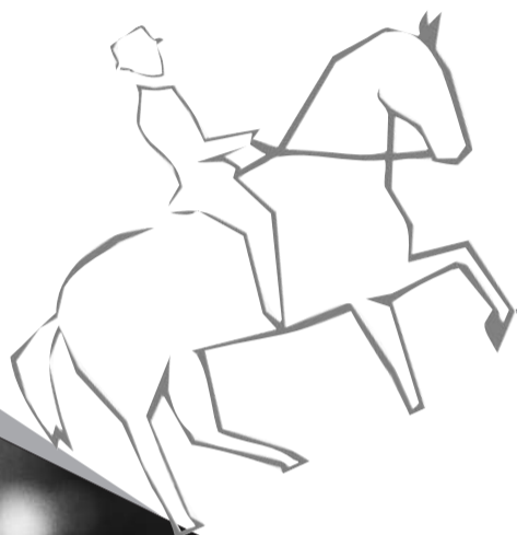
Hiroshi Hoketsu 法华津宽