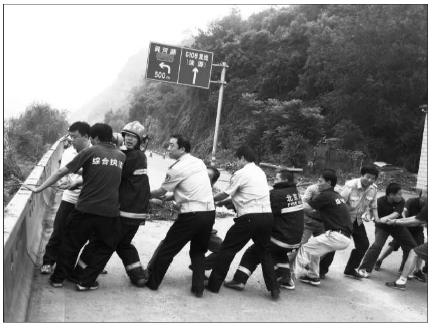
消防员、警察、村民合力将车向岸边拉。