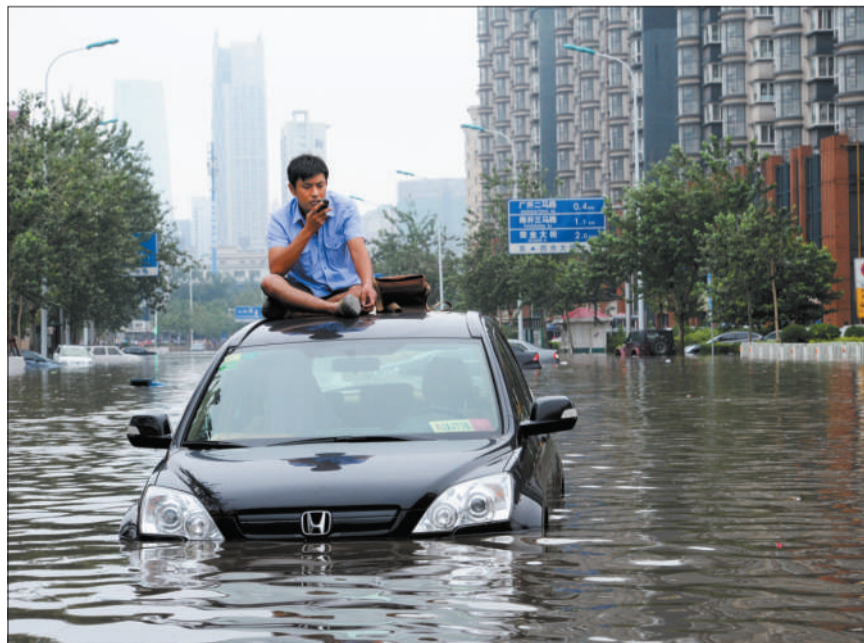
昨日，天津市南开区广开四马路上一位司机等待营救。

据了解，此次降雨致市区达142处积水点位，多个地势低洼的地道及桥下辅路积水深处达3至4米；郊县公路积水点位41处，最深处积水2.6米。