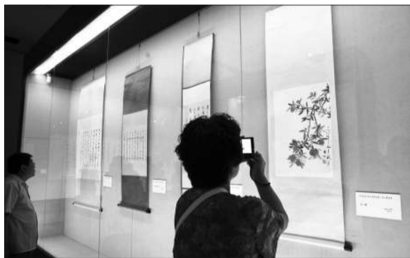
启功诞辰一百周年之际,启功书画展在国博举行。