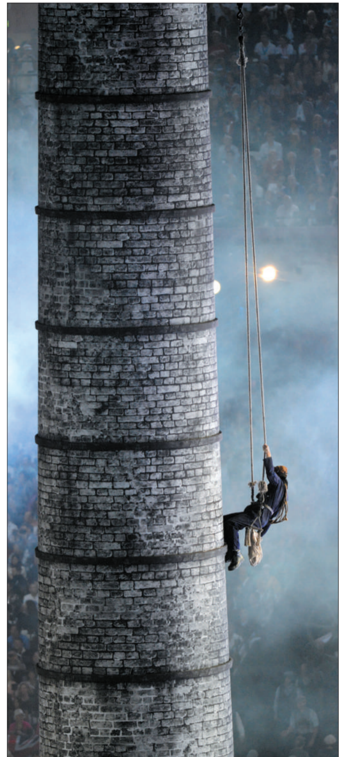
大烟囱是工业革命的显著标志。