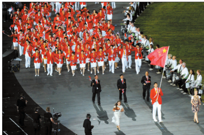
中国代表团穿恒源祥礼服入场,易建联担任旗手。