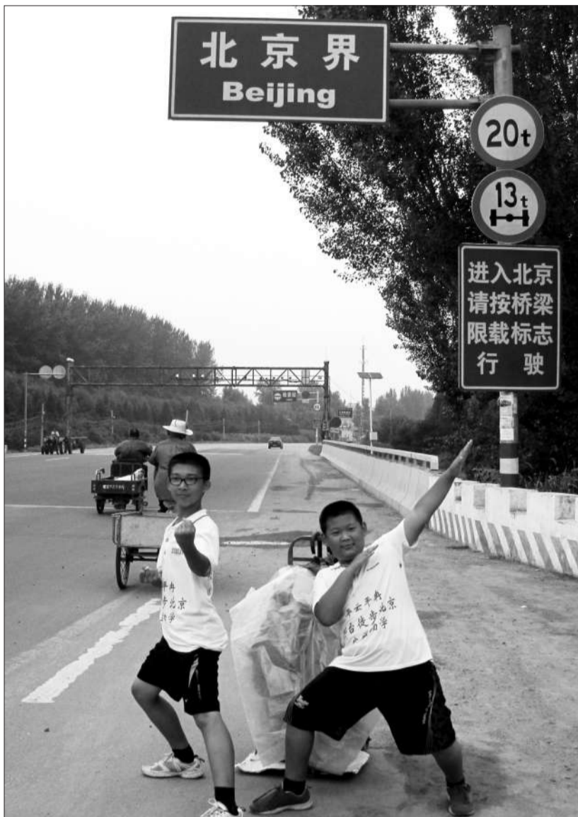
走到北京境内,兄弟俩特别兴奋。近日,河北邢台的两名小学生徒步募捐,帮助家乡的贫困学生。

目前,他们共募集到爱心助学款近7000元,他们计划回家后再继续征集爱心签名,争取能征集到一万个爱心签名。让小哥俩高兴的是,一些爱心人士得知他们徒步劝募活动的初衷后,自发为袁孟菊捐款,解决了她的困难。因此,他们最后决定把这笔善款捐给邢台市慈善总会,由慈善总会选择贫困学生进行救助。