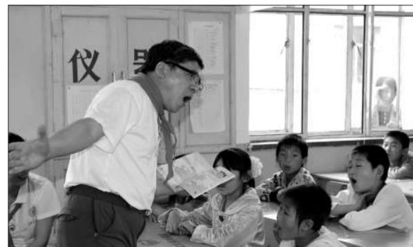
一名参与募捐的北大校友即兴给学生上了课。

“请大家放心,保证孩子们在新学期到来时不淋雨”,耿校长说,将对校舍坍塌围墙以及教室进行加固维修。