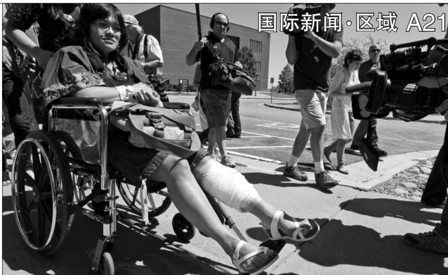
7月30日,科罗拉多州,枪击案受害者离开法庭。