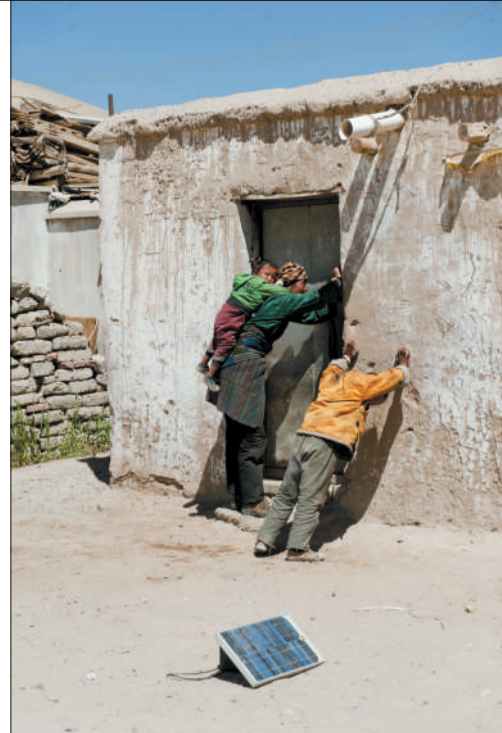
印度人、尼泊尔人也经常会在玛旁雍错岸边沐浴、举行仪式等。当地照明多靠地上的太阳能板，“晒一天够一晚上用”。