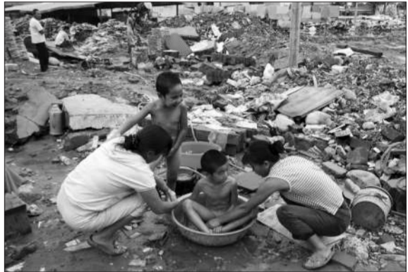
被冲毁的石板厂内,大人正给孩子洗澡。