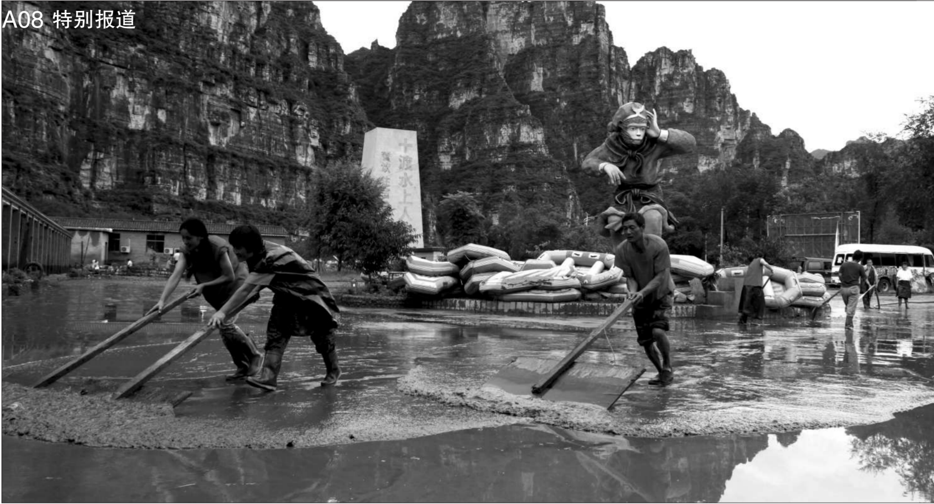
昨日,房山十渡某度假村,工作人员正在清淤。他们希望尽快恢复营业接待顾客,往年的此时是旅游旺季。