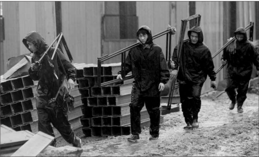
昨日,房山区安置房建设工地上,工人们冒雨进行工作。

危急关头,更显党员召之能战、战之能胜的优秀品质。抢险救灾、防汛抗洪尚未结束,广大党员干部又投入灾后恢复重建工作,群众安置、心理安抚、疫情防控、设施修复、生产恢复……面对一项项繁重工作,受灾区县的党员干部以百倍的热情夜以继日地连续作战,带领群众重建美好家园。