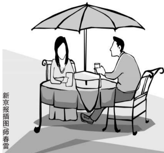
新京报插图/师春雷