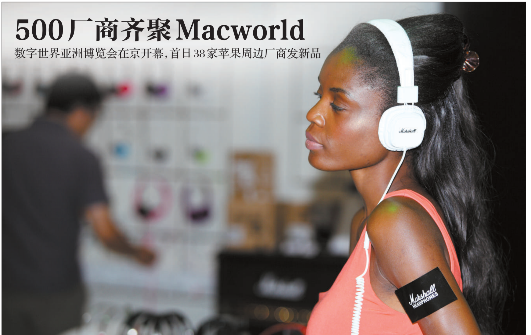
昨日,北京国家会议中心,模特在展示耳机。本届数字世界亚洲博览会将展出上百种移动互联、互动娱乐、Mac产品与服务。